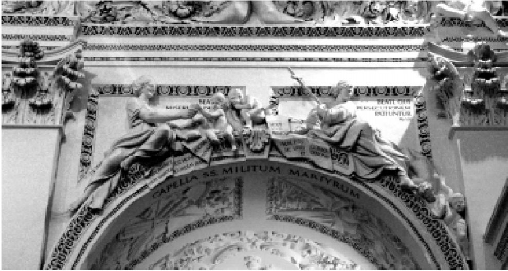
5 pav. P. Pertis ir M. G. Gallis „Palaiminti gailėstingieji“ ir „Palaiminti persekiojami dėl teismo“. 1678–1679 m.

Smulkūs nuogi vaikų kūneliai sudaro kontrastą stambesnei, banguotu rūbu apsiausiai moters figūrai. Tai gana uždara scena, sujungta rankomis ir žvilgsniais, sutelkta į pagrindinį veiksma – duonos perdavimą. Iš šio uždaro išsiveržia tik vaikelio žvilgsnis, susiduriantis su žiūrovo, esančio apačioje, žvilgsniu ir įtraukiantis jį į šią sceną.