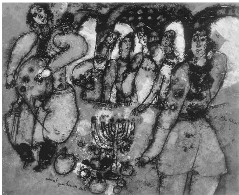
Théo TOBIASSE. Koncertas vieniņiem žmonēms . 1972. Drobē, aliejus