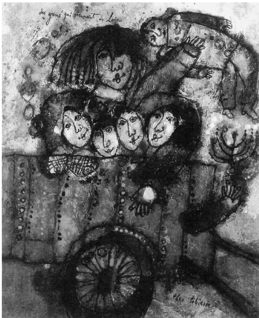
Théo TOBIASSE. Žmonės, kurie atvyko iš toli. 1974. Drobė, aliejus