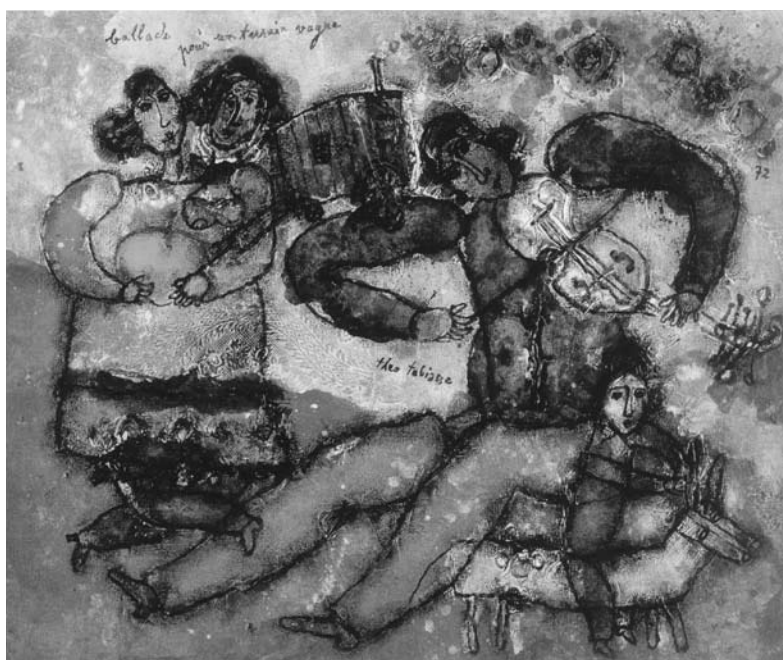
Théo TOBIASSE. Baladē neapgyvendintai žemei . Drobē, aliejus