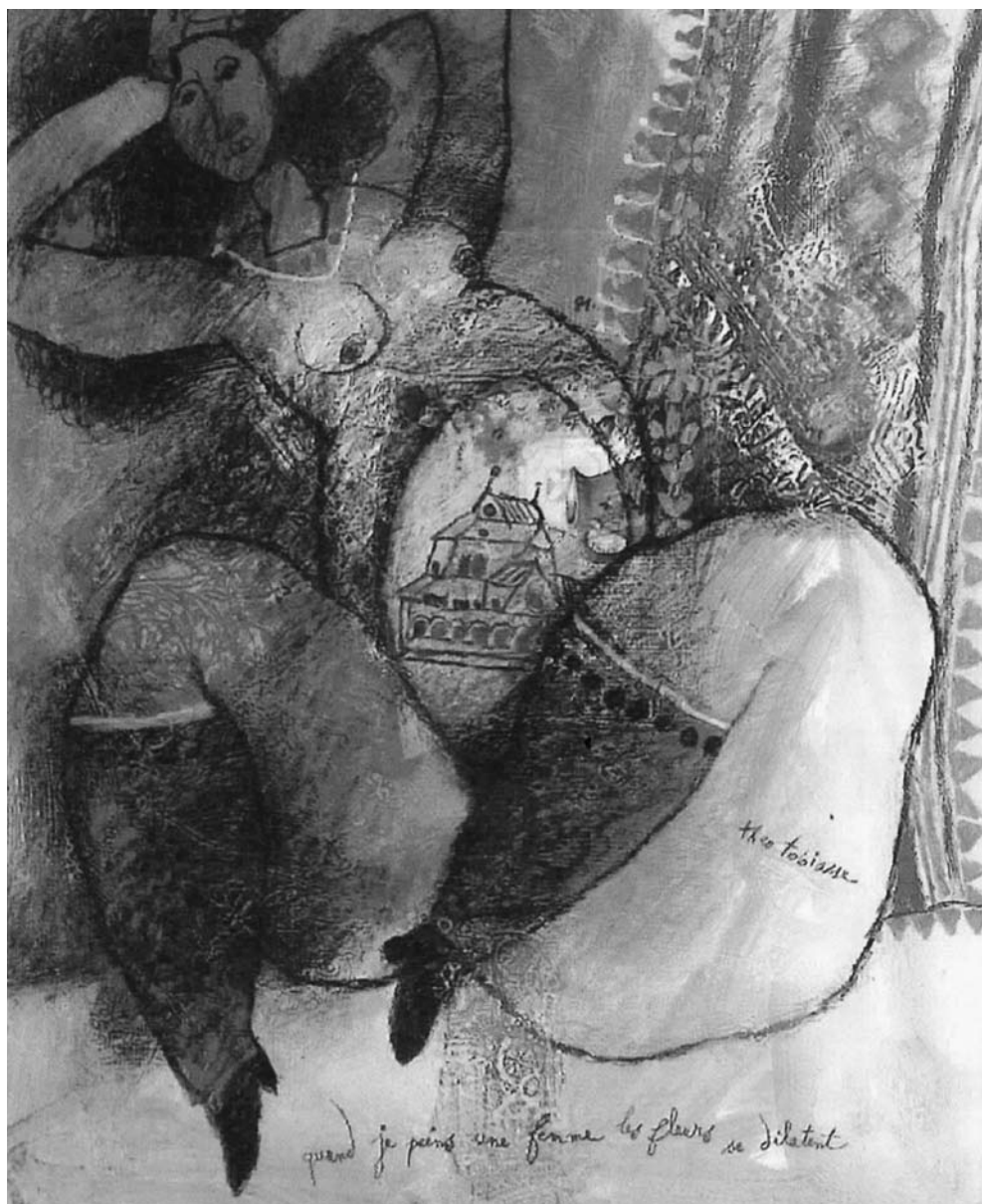
Théo TOBIASSE. Aš tapau moterį . 1981. Drožė, aliejus