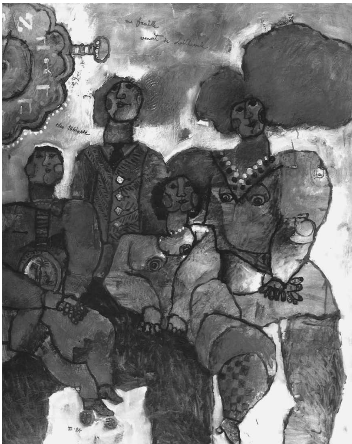
Théo TOBIASSE. Mano šeima atvyko iš Lietuvos . 1984. Drobė, aliejus