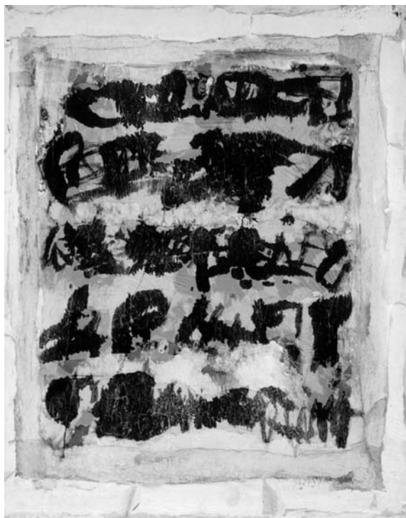
Jonas MALDŽIŪNAS Neįskaitomi rašmenys . 2000 Popierius, akrilas, tušas, mišri technika. 120 × 90