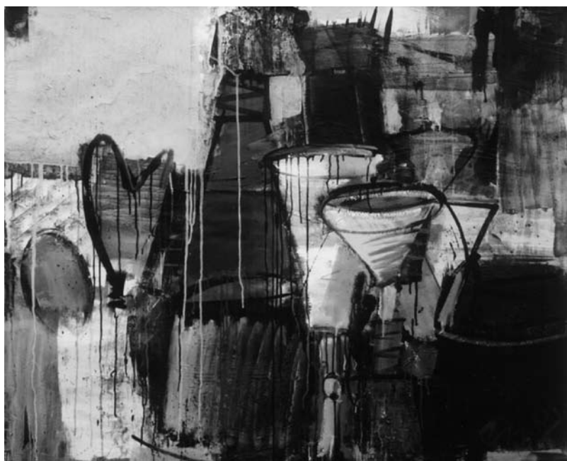
Jonas MALDŽIŪNAS. Mėlynas natūrmortas . 2000. Popierius, akrilas, tušas, mišri technika