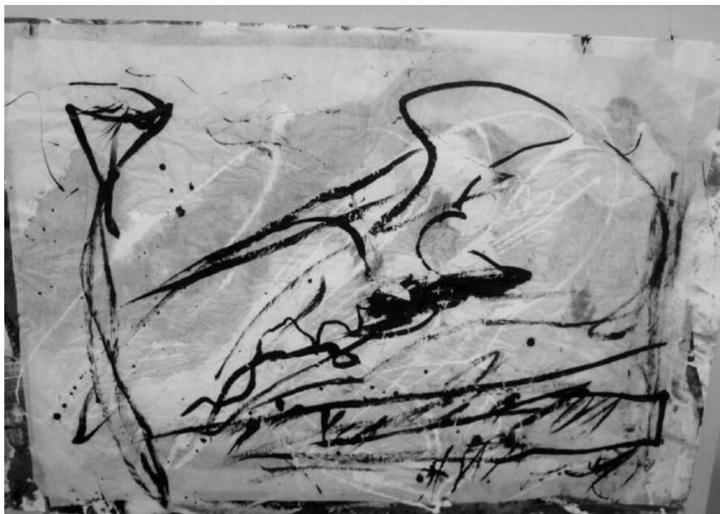
Jonas MALDŽIŪNAS. Piešinys Kaukolė ir taurė . 2002. Popierius, akrilas, tušas, mišri technika