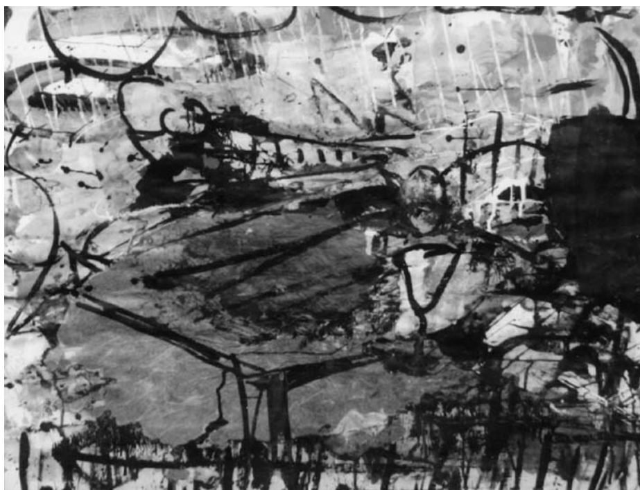
Jonas MALDŽIŪNAS. Atsisveikinimas su Nemunu . 2002. Popierius, akrilas, tušas, mišri technika. 75 × 100