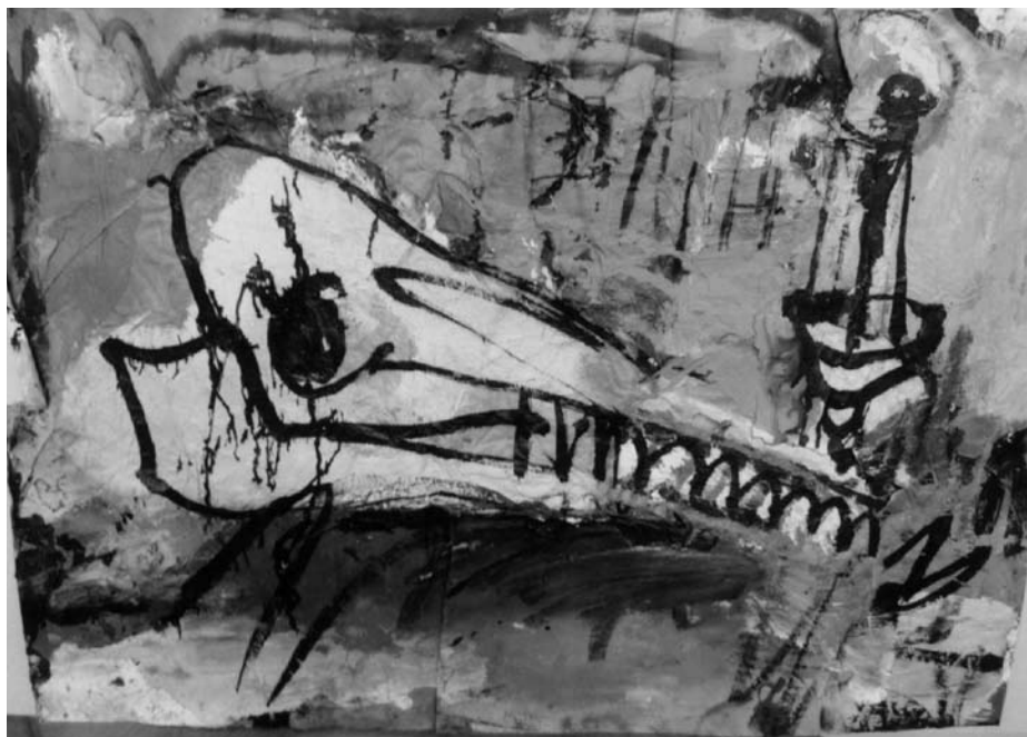
Jonas MALDŽIŪNAS. Kaukolė ir žvakė . 2002. Popierius, akrilas, tušas, mišri technika