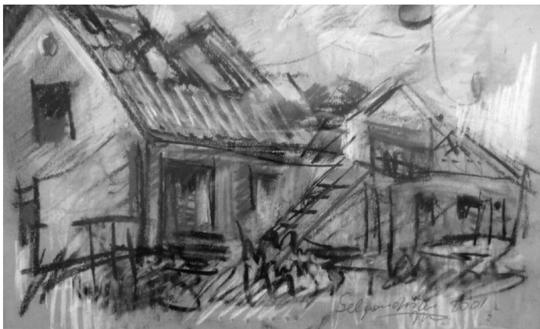
Jonas MALDŽIŪNAS. Namelis Gelgaudiškyje . 1998. Pastelė