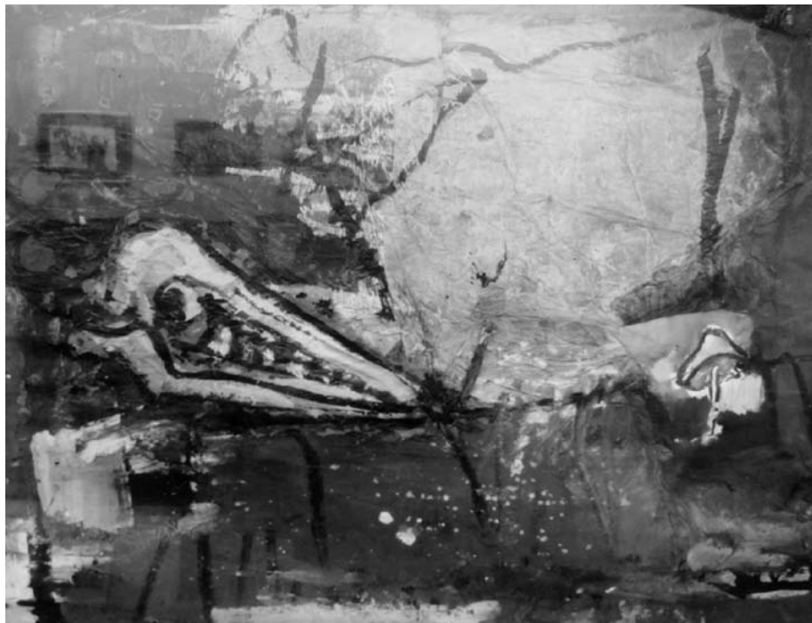
Jonas MALDŽIŪNAS. Atsisveikinimas su Nemunu III . 2002. Popierius, akrilas, tušas, mišri technika. 75 × 100