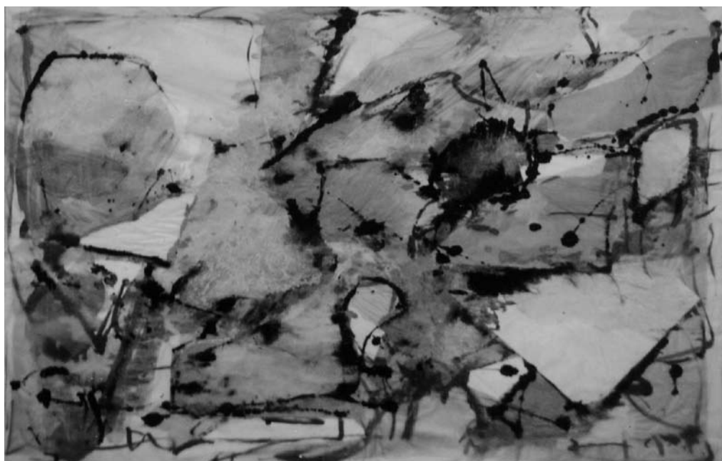
Jonas MALDŽIŪNAS. Akmenys ir vanduo . 2001. Popierius, akrilas, tušas, mišri technika. 120 × 90