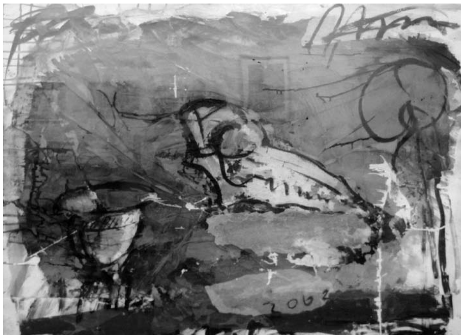
Jonas MALDŽIŪNAS. Atsisveikinimas su Nemunu II . 2002. Popierius, akrilas, tušas, mišri technika. 75 × 100