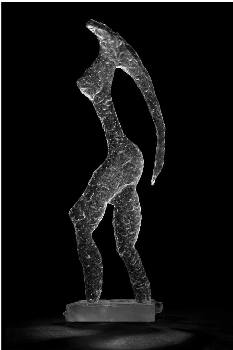
Sigita GRABLIAUSKAITĖ. Stiklo skulptūra Moteris, bėganti pakrante . 2014