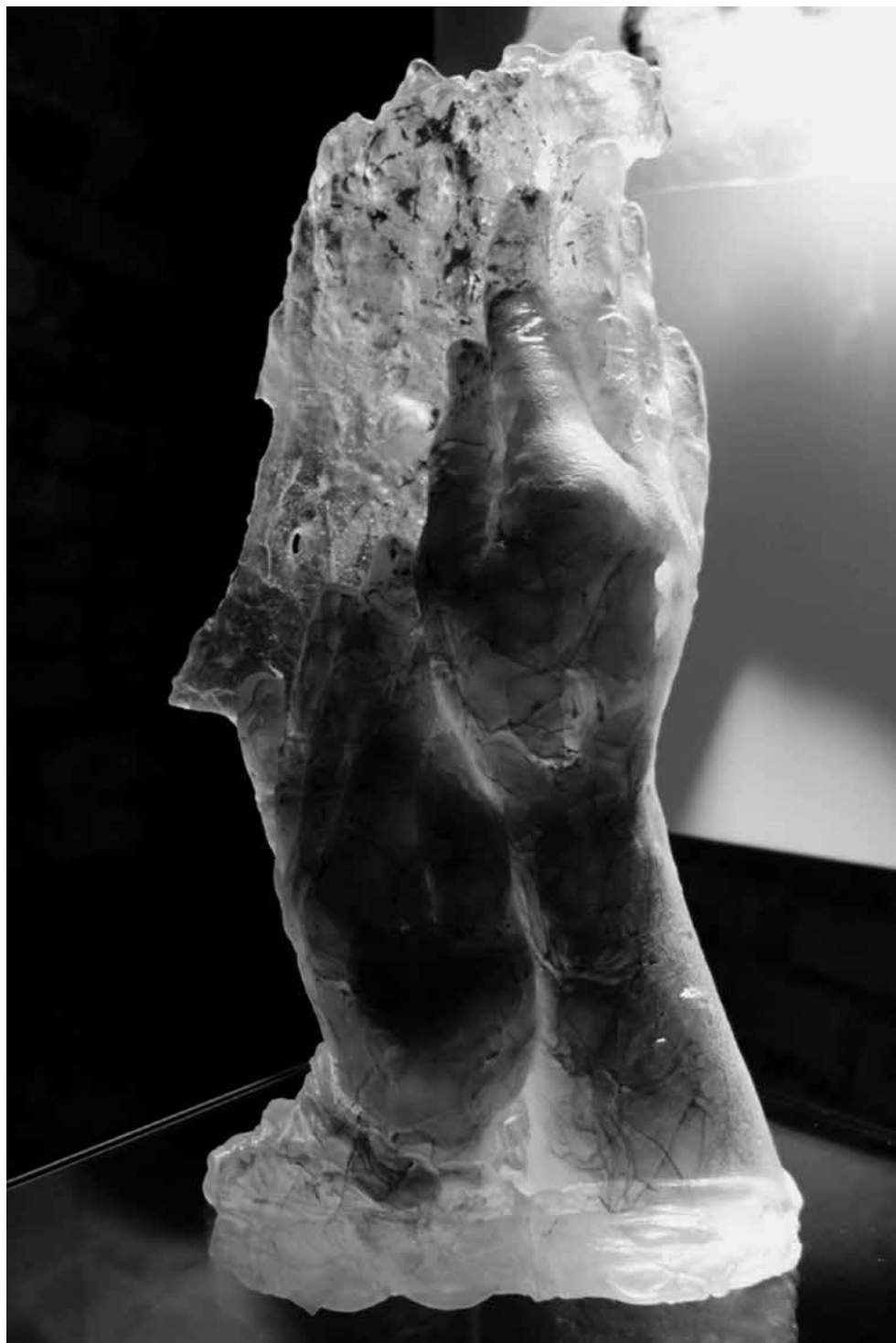
Sigita GRABLIAUSKAITĖ. Stiklo skulptūra Siekiamybė . 2008