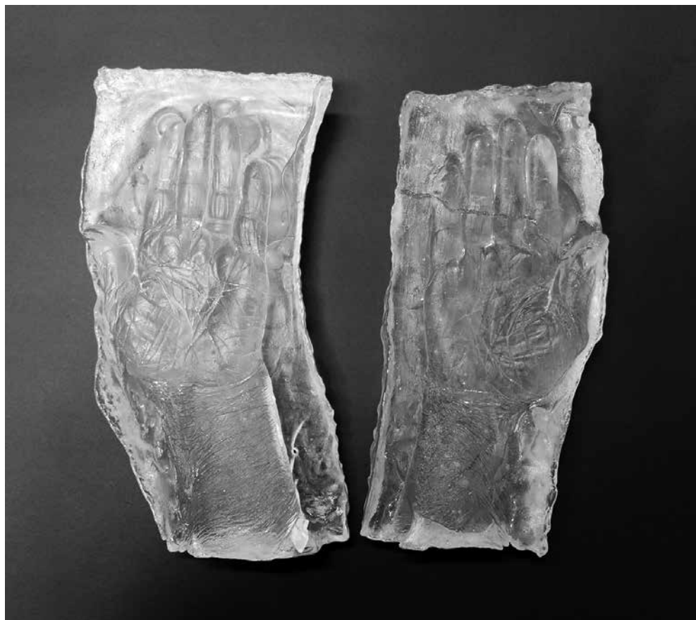
Sigita GRABLIAUSKAITĖ. Stiklo reljefas Istorijos mamos rankose . 2017