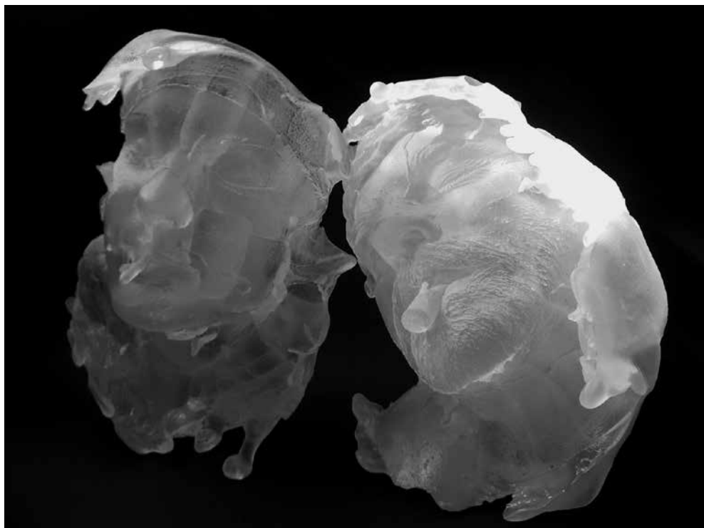
Sigita GRABLIAUSKAITĖ. Stiklo skulptūra Miegantys laike . 2008