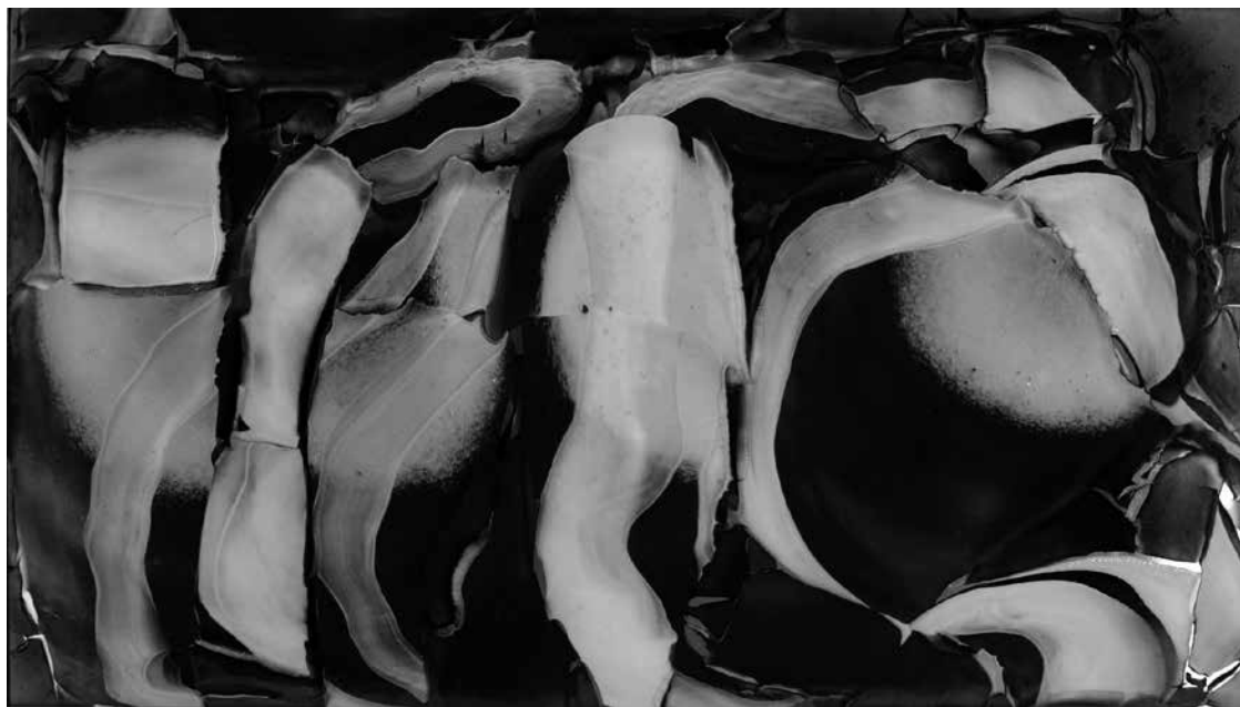
Sigita GRABLIAUSKAITĖ. Stiklo plokštė iš ciklo Tulpės naktyje . 2009