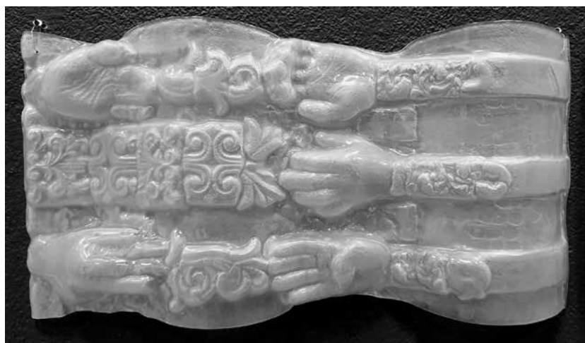
Sigita GRABLIAUSKAITĖ. Stiklo reljefas Pasikartojantys praeities fragmentai (detalė). 2018